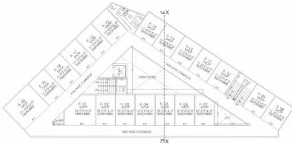
FIRST & SECOND FLOOR PLAN